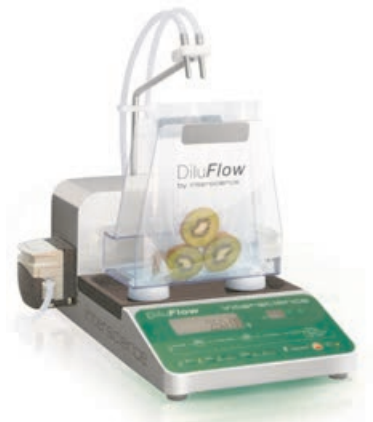
DiluFlow Verdüner 3 kg