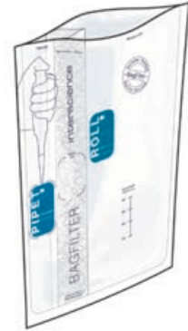
BagFilter Pipet & Roll 400