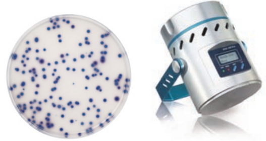
MAS-100 ECO Luftkeimsammler

Der Luftkeimsammler MAS-100 ECO ist das Standardgerät für die Luftüberwachung in der Lebensmittelindustrie: Petrischale einlegen und los geht's.