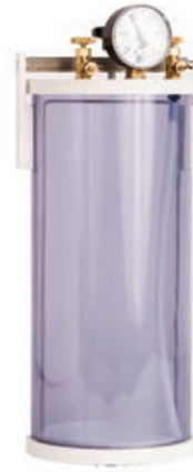
Anaeroben-Behälter groß mit Begasungsset

Die Anaeroben-Behälter von Dinkelberg analytics eignen sich sehr gut für die Anreicherung von anaeroben, mikroaerophilen oder CO 2 -abhängigen Organismen unter sauerstofffreien Bedingungen. Die Anaerobenbehälter verfügen über ein herausnehmbares Stativ für die Begasung von Flaschen und Nährböden. Die anaerobe Umgebung kann durch die Beigabe von Beuteln oder durch den Anschluss an die Gasleitung (notwendig: das Begasungsset) erzeugt werden. Dadurch erzeugen Sie weniger Müll.