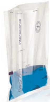
BagFilter P 400

Wir führen das passende Verbrauchsmaterial zu den BagMixern wie Stomacherbeutel, Langpipettenspitzen für die BagPipets etc. Immer ab Lager verfügbar.