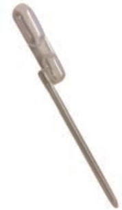
Fixed Volume Pipette 300µl