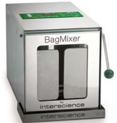
Homogenisator BagMixer 400 CC

Die gravimetrische Verdüner DiluFlow ermöglichen die Verdünnung einer Probe vor Ihrer Homogenisierung zu automatisieren. Dadurch wird der Prozess zuverlässiger. Wir führen das gesamte Sortiment für ein Gesamtgewicht von 1 kg bis 5 kg.