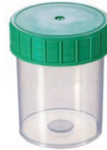
Probenbecher 125 ml, gerade Form

Proben müssen transportiert und gelagert werden. Das Sortiment an sterilen und unsterilen Probenbechern und Behältern ist immer ab Lager lieferbar. Nutzen Sie die Vorteilsbedingungen.