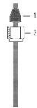
1/8" gepackte Edelstahlsäule